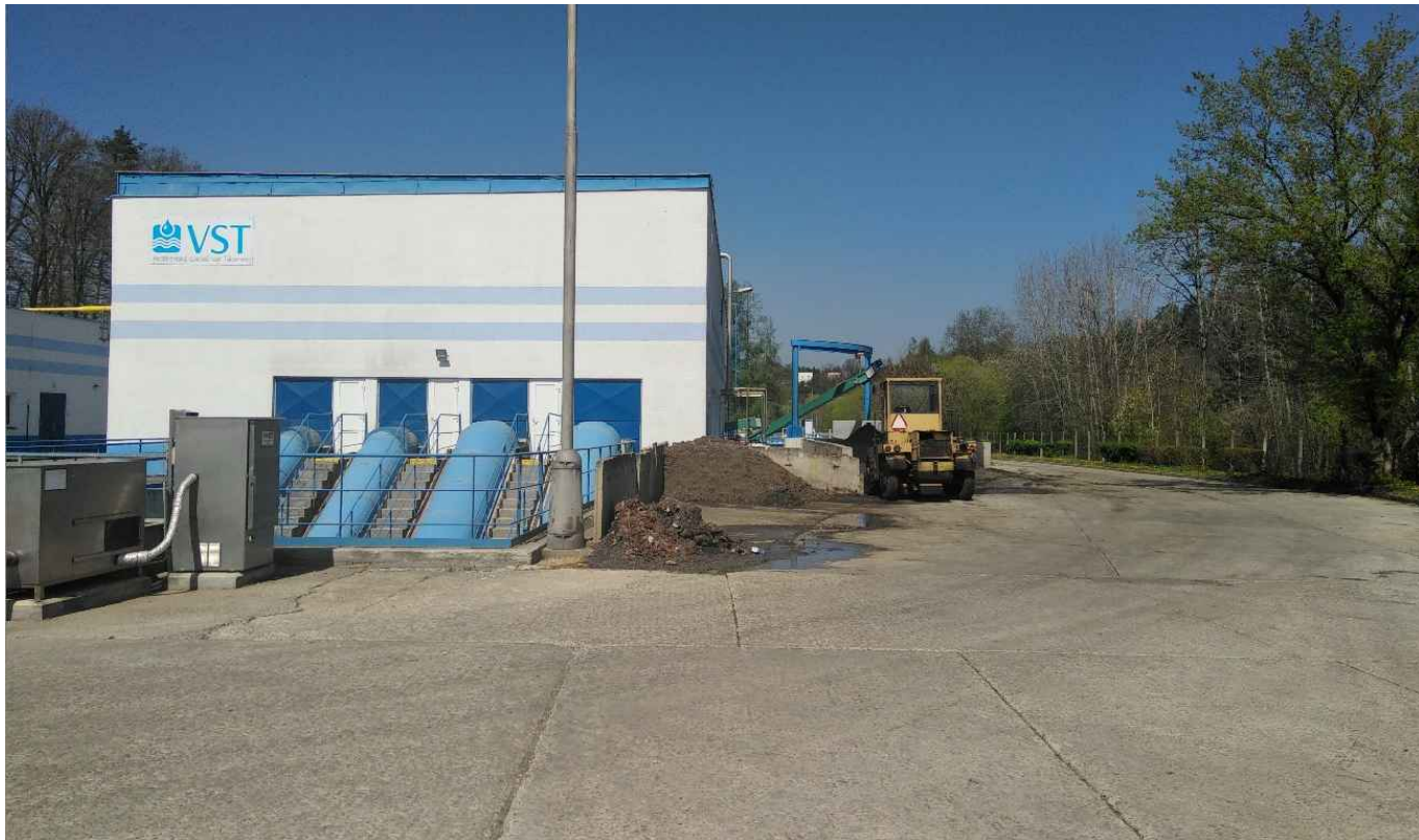
FOTODOKUMENTACE STÁVAJÍCÍHO ÚZEMÍ PRO UMÍSTĚNÍ OBJEKTU