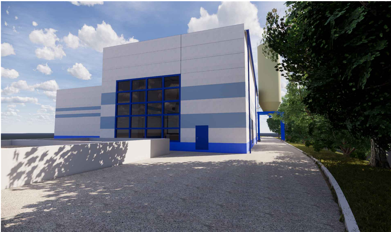
VIZUALIZACE PROSTOROVÉHO MODELU - JIŽNÍ A VÝCHODNÍ STRANA OBJEKTU