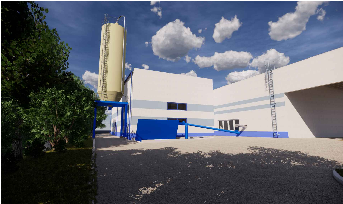
VIZUALIZACE PROSTOROVÉHO MODELU - SEVERNÍ STRANA A PTAČÍ PERSPEKTIVA